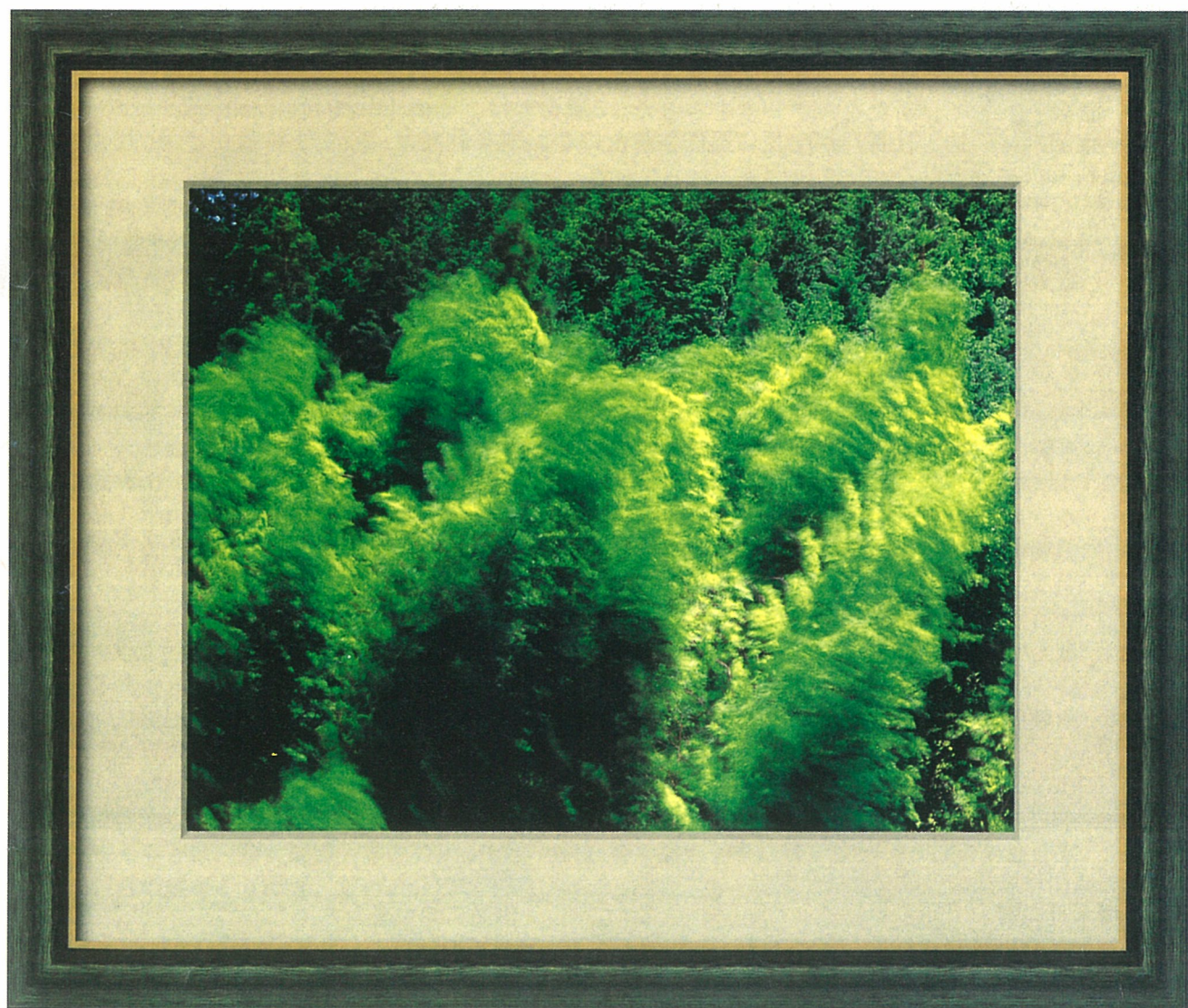
風（高知県大野見村） 津田洋甫写真集「一期一会」より