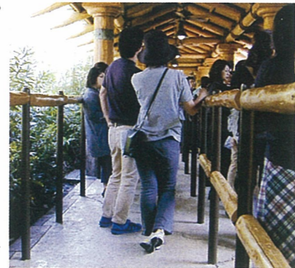
ユニバーサルスタジオで当社が企画設計した杉間伐材の手すり。ウェスタン風仕上げ。

また、杉の間伐をきっちりとすることも、その対策になる。間伐をする事は山を生かし続ける事と、花粉症対策との2つの重要な仕事である。