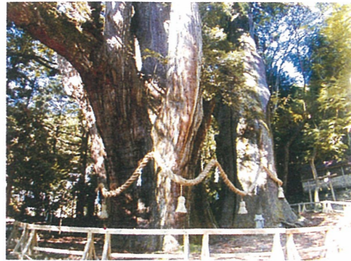
杉の大杉 高知県大豊町 2001年撮影

巨樹として有名な縄文杉が昭和42年に発見される前には、日本最大の杉と言われていたのが高知県の「杉の大杉」である。数年前に訪問したが、美空ひばりが、子供の頃この杉に「日本一の歌手になれるように」と願いをかけたことが有名で完全に観光化されている。杉を見るのに入場料が必要なこと