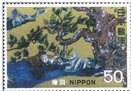
日本の切手に描かれた唯一の桧 国宝シリーズ1次 桧図(狩野永徳)1969年

この経年変化の性質はどうも針葉樹特有のものだと思います。バイオリンのストラディヴァリウスなどの名器は製作した職人の技術力もありますが、古いものほどいいと言われています。この年数が必要なのは、先の性質で説明できますが、そうするとあまりに古くなると、逆に音が悪くなるという可能性があるのではないのでしょうか。高いバイオリンを持っている方、注意してください。今から予言しておきます。