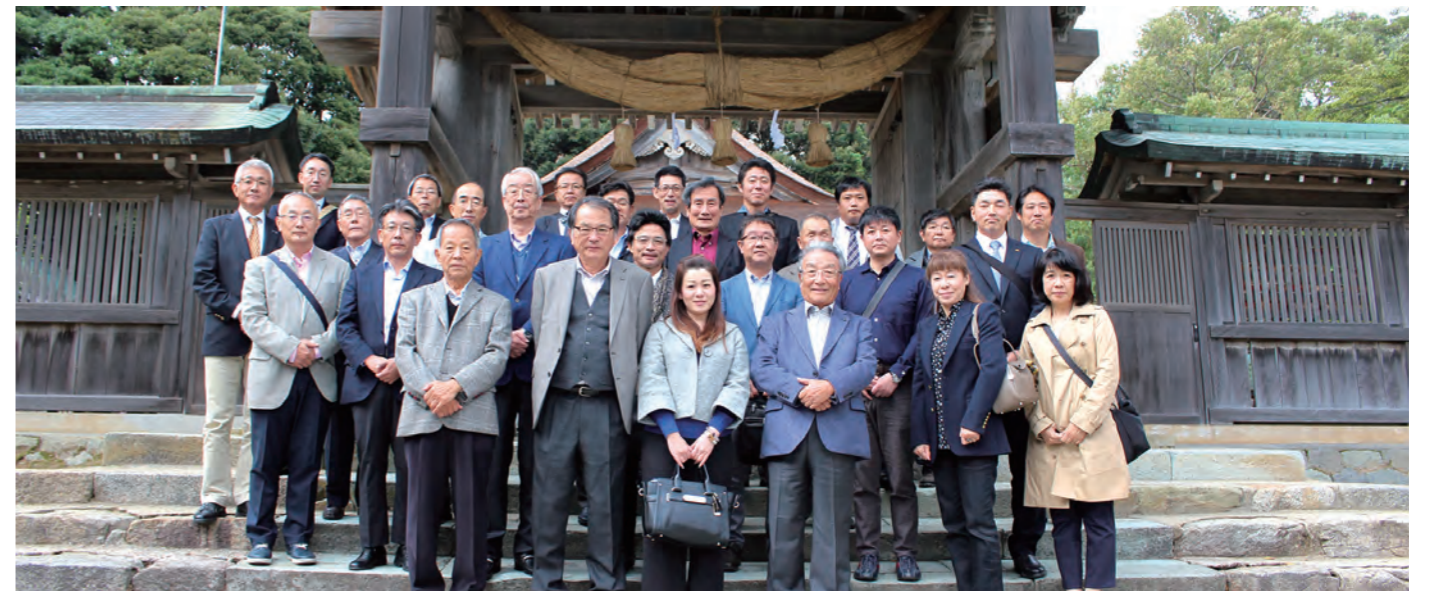
■気多大社 神門(重要文化財)前