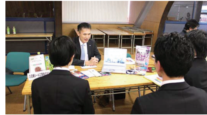
■「合同企業説明会」の様子