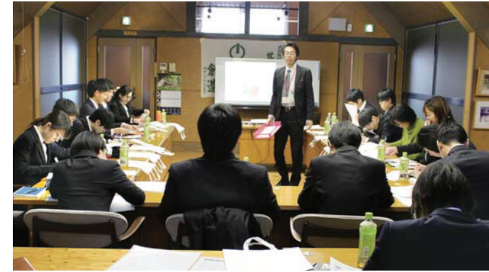
■「業界理解セミナー」の様子

当日はさかいJOBステーションの担当者より求職者に対して、当工場団地及び参加組合員への理解度を高めるための「業界理解セミナー」が3階小会議室において開催され、その後、2階大会議室において参加企業6社による合同企業説明会が開催された。