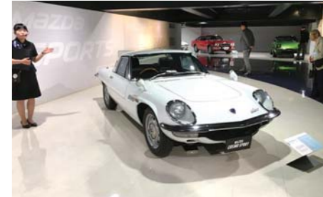
■マツダミュージアム見学風景

立ちどまらない保険。安心と安全のコンサルタント MS&AD 損害保険・生命保険のことなら 保険代理店 MSK保険センター株式会社 堺支店