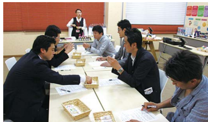
■株式会社ヤマサキ 研修風景

今回は、企業訪問を通じて見聞を広めると共に、戦争と被爆地としての歴史と共生してきた広島にて、戦争や平和について深く考えさせられる研修旅行となった。