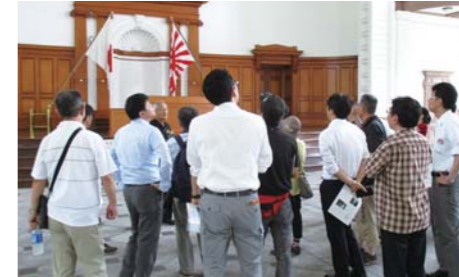
■海上自衛隊第一術科学校視察風景