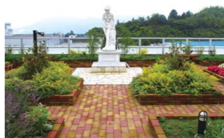
■株式会社ヤマサキ 屋上庭園