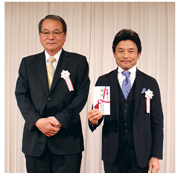
■中畑理事長と石本社長