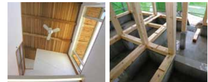
▲杉の天井現し参考例