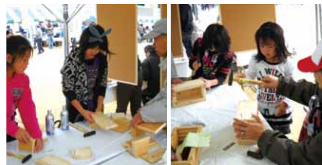
▲写真は昨年のもので

本年は、「木製プランター製作」の無料体験教室を出店内容として準備を進めております。多数のご来場をお待ちしております。