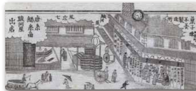
▲「住吉・堺名所并豪商家内記」(明治16年刊。堺市立中央図書館蔵)