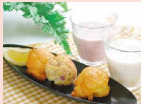
芋類をふんだんに使ったドーナツとドリンクをご用意しました。芋の甘味がやさしいおやつです。