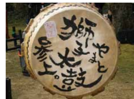
▲破れた皮を再利用

太鼓を打つ前に皮にそっと手を置き「今から打たせていただきます」と心の中でつぶやき打てる感謝を述べます、そうしたほうが心を落ち着かせ太鼓と一心同体になった気持ちになり、思い通りの音を出してくれるような気がします。