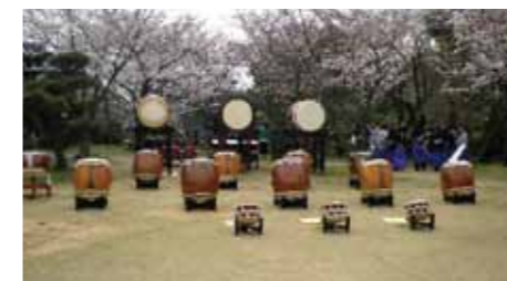
▲今年春郡山城での演奏前