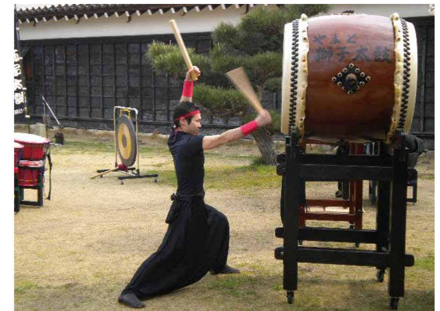
▲およそ350年前の大太鼓