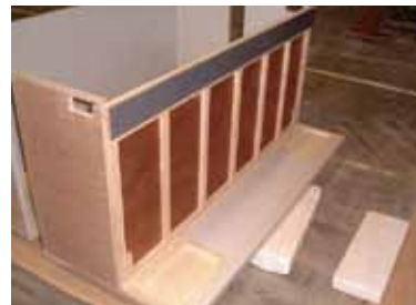
▲加工中 カウンター