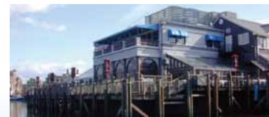
▲施工例 (USJ ロンパースデッキ)