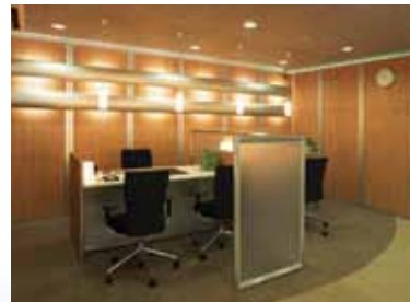
▲施行例 カウンター