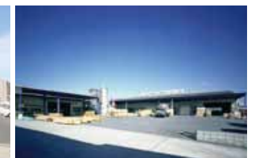
▲プレカット事業部 和歌山工場