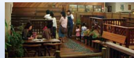
▲本社ショールーム