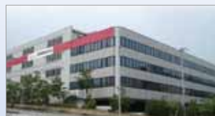
▲神戸物流センター