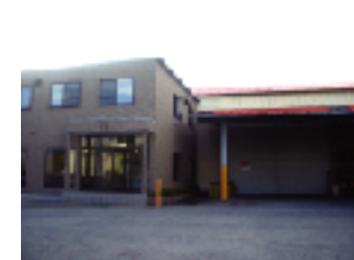
▲ジャパン建材(株) 阪南営業所

【事業内容・営業品目】 総合建材卸売事業・合板製造販売事業・フランチャイズ事業・その他住宅関連事業