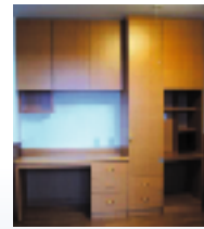
▲収納デスクセット