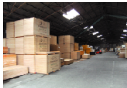
▲南大阪支店第二倉庫内