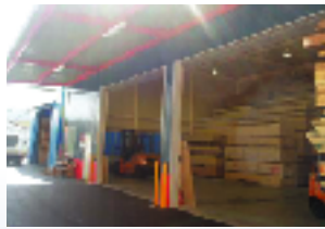
▲南大阪営業所内部