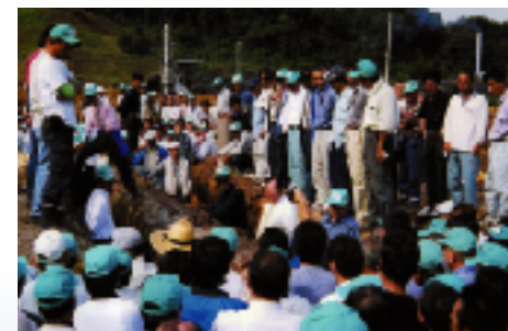
▲南大阪支店第二倉庫内

針葉樹・広葉樹の生産、仕入、販売 造材、造林作業の請負 各種の伐採、除去作業の請負 林業に関する一切の業務 一般土木建築工事の設計、施工 土地、建物賃貸 不動産、土地、山林の売買 造園工事の設計、施工 林地の有効利用に関する業務