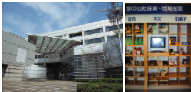
▲堺市産業振興センター

一番重い木(リグナムバイタ)や世界で一番軽い木(バルサ)等の比較や木の良さや温かみを体感できるようなコーナーに見直しを行った。お近くに立ち寄りられた際には是非体感してみてください。