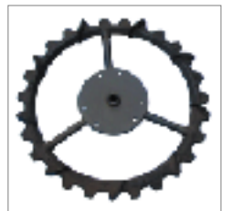
▲製品例(農業用機械部品)