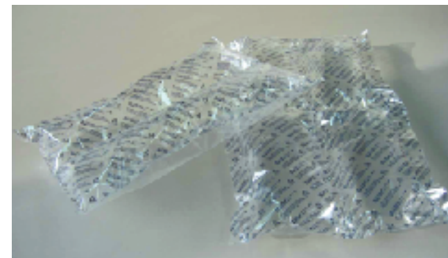
▲製品例(空気緩衝材/エアーパーツ)

ダンボールケースの製造/販売 クラフトケース(美粧ケース)の製造/販売 空気緩衝材(自社開発した環境に優しい画期的な緩衝材) 包装資材の製造販売