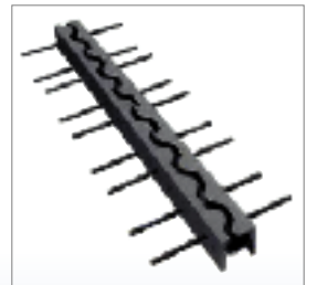
▲製品例(高架道路用伸縮装置)