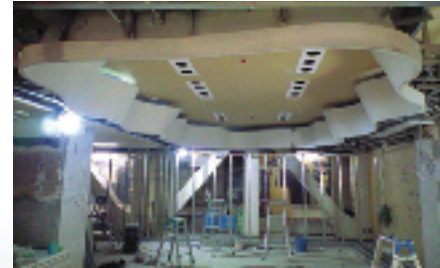
▲ウェーブ状幕板取付けの様子