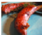
◀自慢の手作りソーセージ

“ゲストハウスばあく”で、泉澤農場でじっくりと育てられた豚肉を利用して作られた手作りのランチを頂きました。地元のお母さん達の手で心をこめて作られた、ハムやスモークベーコン・ポーンソーセージのランチは「こんなに、お肉の旨みを感じるハムははじめてかも!」と、うなる位絶品でした。「残さず全部いただきます」と先ほど対面した豚さんたちに心からありがとうを…。