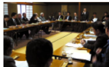
▲「得月楼」にて全員例会

初日は、「桂浜」散策、「龍馬の生まれたまち記念館」など同県出身の『坂本龍馬』ゆかりの場所を見学したあと創業明治3年「陽暉楼」のモデルとなった『得月楼』(高知市内)に於いて、協同組合の平成20年度上期事業報告と(株)大阪木材団地サービスの株主総会が行われ、翌日は、観光(引き続き、坂本龍馬の足跡を辿る)やゴルフコンペ(第28回カシオワールドオープン開催コース「黒潮カントリークラブ」にて)で各々参加者相互の親睦の和を深めた。